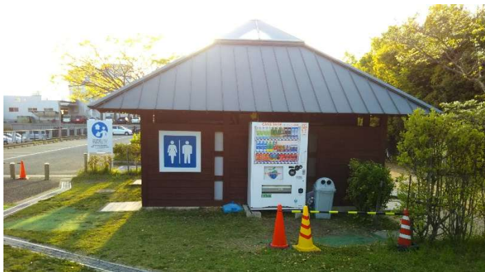
キャンプ場専用トイレ