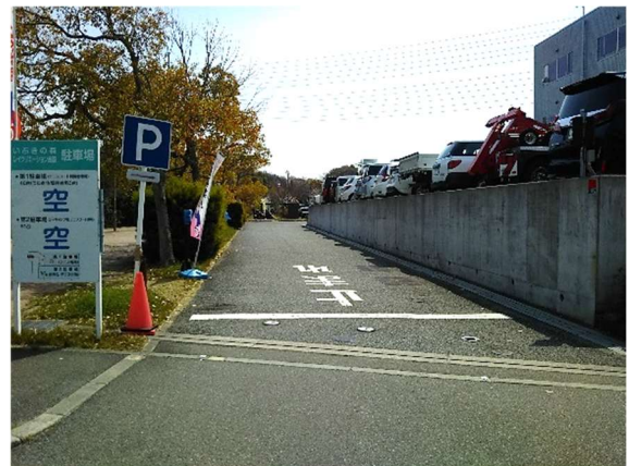
いぶきの森デイキャンプ場進入路