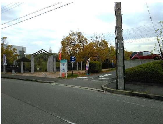
いぶきの森デイキャンプ場入口