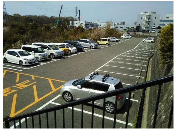
デイキャンプ場駐車場入り口 ※キャンプ用にお停めください デイキャンプ場駐車場